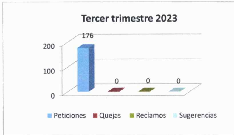
Tabla 3: Relación del 01 de julio al 30 de septiembre de 2023