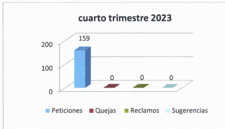
Tabla 3: Relación del 01 de octubre al 31 de diciembre de 2023